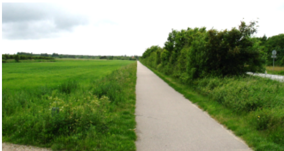
Cykelsti langs Vesterhavsvej set fra indkørslen til området

Mod nord støder lokalplanområdet op til Vesterhavsvej, der har en cykelsti i eget tracé på den sydlige side. Cykelstien forbinder Nr. Nebel, og Nymindegab. Længere mod nord ligger der en lille samling beboelsesejendomme ved Kærvej.