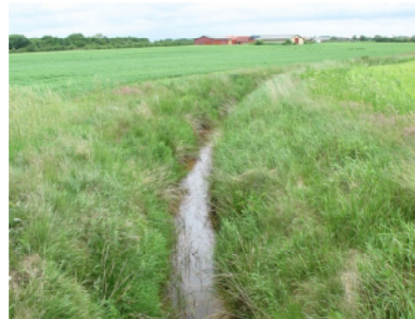
Afvandingsgrøft gennem området

Størstedelen af lokalplanområdet er opdyrket agerjord med enkelte nord-sydgående læbælter.