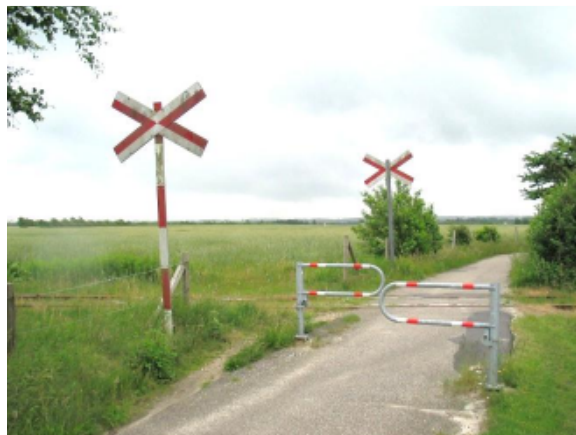
Cykelsti krydser gammel jernbane mod Lønne i nordvestlige hjørne af lokalplanområdet

Øst for området er der opdyrket agerjord og enkelte beboelsesejendomme. Længere mod øst er den nord-sydgående Blåbjergvej, der forbinder Nr. Nebel med Henne stationsby og Henne Kirkeby. Længere mod øst ligger Nr. Nebel som i kommuneplanen er defineret som områdeby med et væsentligt udvalg af butikker og liberale erhverv samt blandt andet læge, svømmehal og andre offentlige servicetilbud.