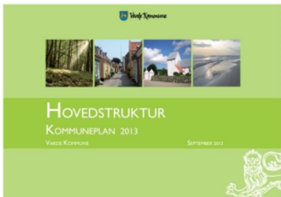
Kommuneplan 2013, Varde Kommune