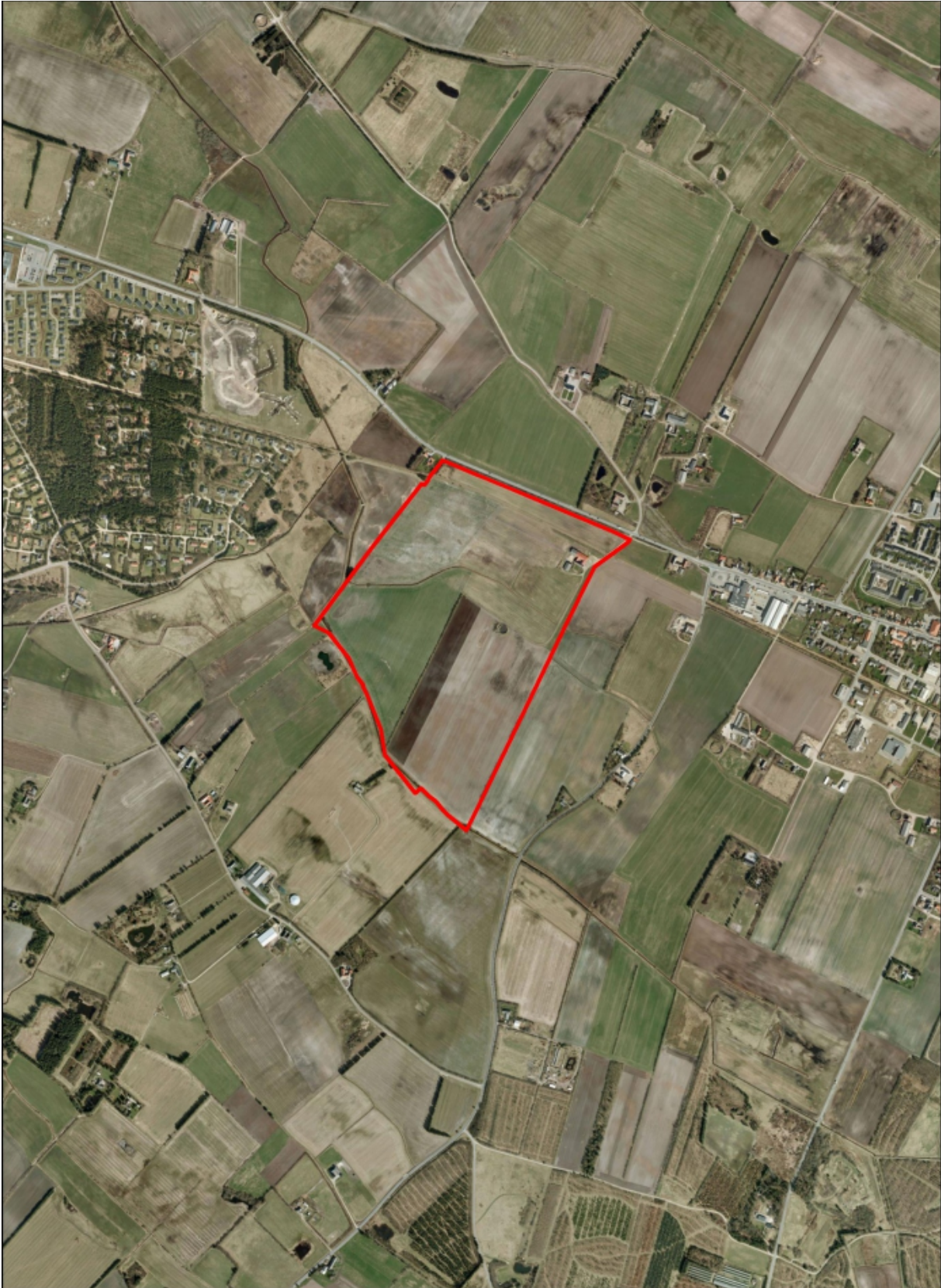
Lokalplanområdet vist med rød streg på luftfoto fra 2011, målestoksforhold 1:15.000