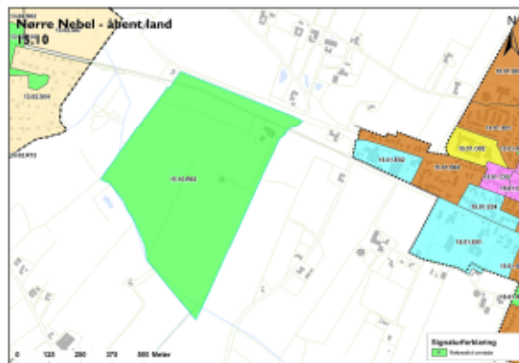
Udsnit af kommuneplanens rammekort

Rekreativt område, Landzone, Dyrepark/ZOO, bebyggelsehøjde 8,5 meter, maksimalt 2 etager, opholdsarealer fastlægges ved lokalplanlægning, Parkeringsbehovet skal dækkes inden for området og fastsættes ved lokalplanlægning. Lokalplaner skal indeholde bestemmelser, der sikrer mulig genskabelse af et vådområde og sikrer dyr og planter spredningsmuligheder langs områdets syd-/vestlige grænse. Derudover skal lokalplanen indeholde bestemmelser, der sikrer de landskabelige værdier i området.