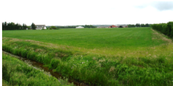
Opdyrkede arealer og gårde syd for Nebel Bæk

Syd for området ligger opdyrkede arealer med spredt bebyggelse i form af stuehuse og landbrugsbygninger langs Lønnehedevej.