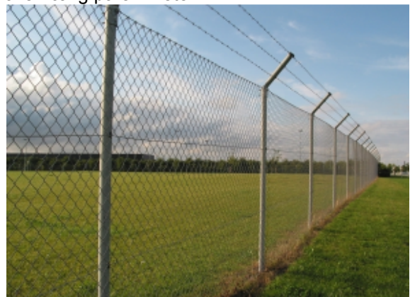
Illustration af sikkerhedshegn

Der etableres et 10 meter beplantningsbælte langs en stor del af den ydre afgrænsning. På innersiden af plantebæltet placeres et tre meter højt ydre sikkerhedsstrådhegn med 45 grader overhæng på en meter.